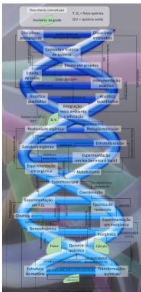
Figura 3. Mapa que mostra a área de ensino de Química fortemente relacionada à QAmb.